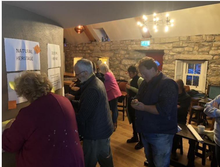
Tráthnóna Faisnéise Pobail, Cill Tíle, Meán Fómhair 2022