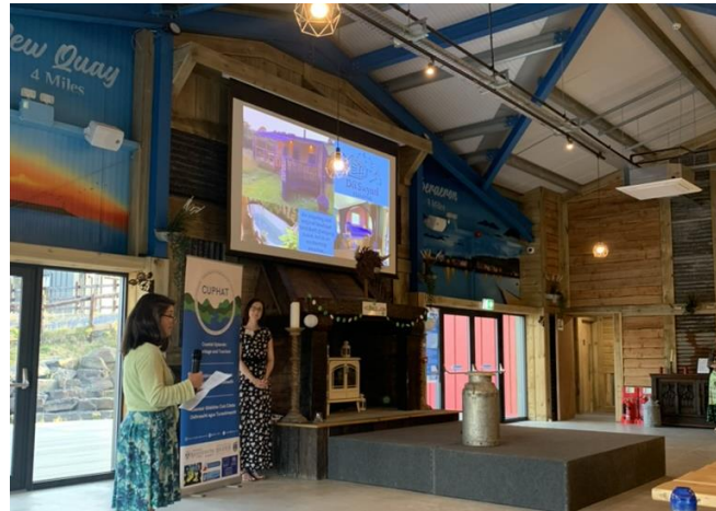
Ócáid cheiliúrtha a réachtáladh sa Bhreatain Bheag, Meitheamh 2023.