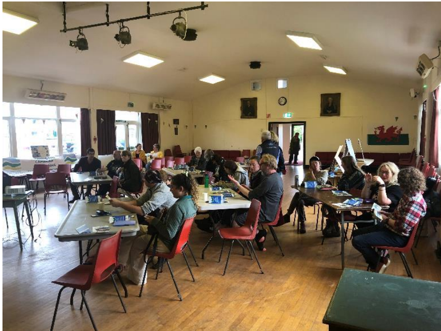
Ócáid Seolta Pobail, Sléibhte Chambrianach, Meitheamh 2022