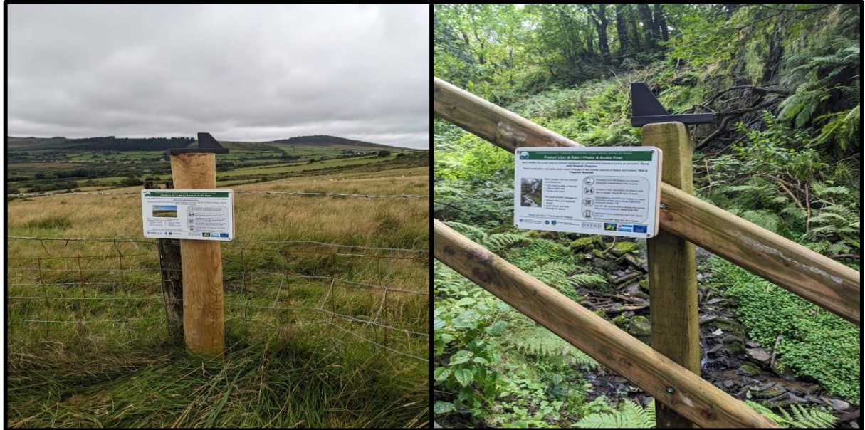
Figiúr 3: Cuailí grianghraf agus fuaimne suiteáilte ag eas Tregynon agus ag Gweunydd Blaencleddau (le Foel Drigan sa chúlra), Sléibhte Preseli.