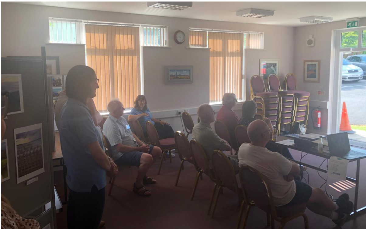
Ag éisteacht le sleachta staire béil ag Ócáid Fhéile Mynydd Preseli CUPHAT, Maenchlochog, Meitheamh 2023

stairiúla a dteaghligh le go ndéanfaí iad a dhigitiú agus a chur ar fáil don phobal. Lean tuairiscí ar ár spéis agus ár ndíograis i leith an ábhair a scaipeadh timpeall na bpobal agus na n-ábhar de bheith le feiceáil go dtí gur dúnadh na himeachtaí. Tugadh le fios san aiseolas ina dhiaidh sin gur mheabhraigh na himeachtaí seo do phobail tábhacht agus luach a n-oidhreacht.