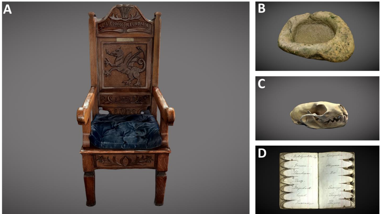
A selection of artefacts captured using Polycam. A: Bardic chair from 1938 Eisteddfod. B: Post medieval hollowed out stone C: Pine marten skull. D: 19 th century sheep ear tagging book.